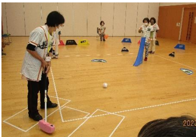
レクリエーション講座